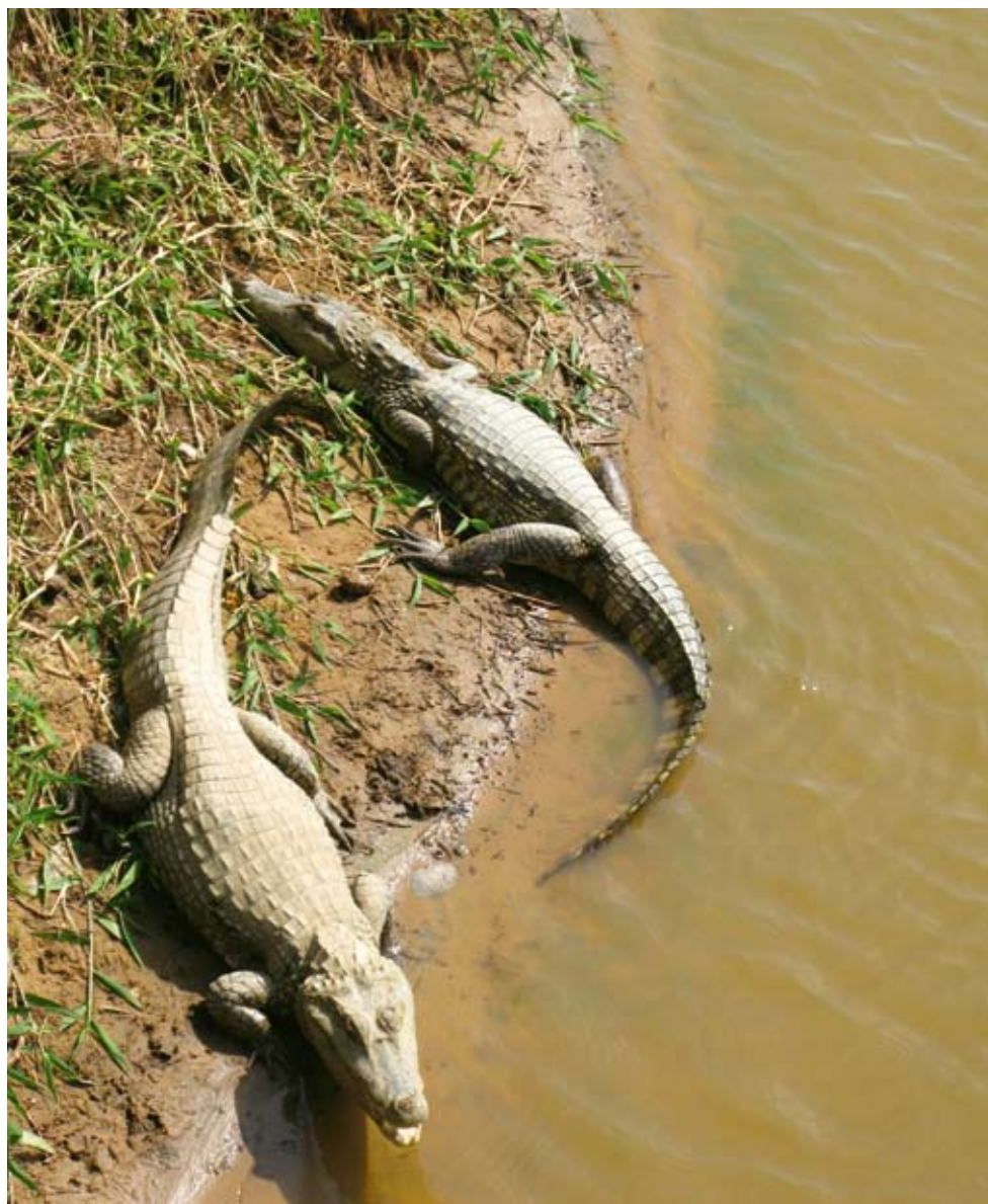
I torkan strax före regnperioden söker sig många djur till kvarvarande vattensamlingar. Där väntar kajmanerna i tjugotal.

Los Llanos är ett enormt slättland som sträcker sig över Venezuela och Colombia och upptar en yta lika stor som hela Sverige. Eftersom det är nära till ekvatorn är klimatet varmt året om och med-