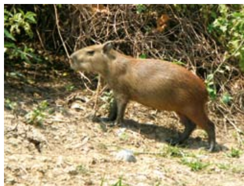
Karpyan, världens största gnagare, är en oväntad syn.