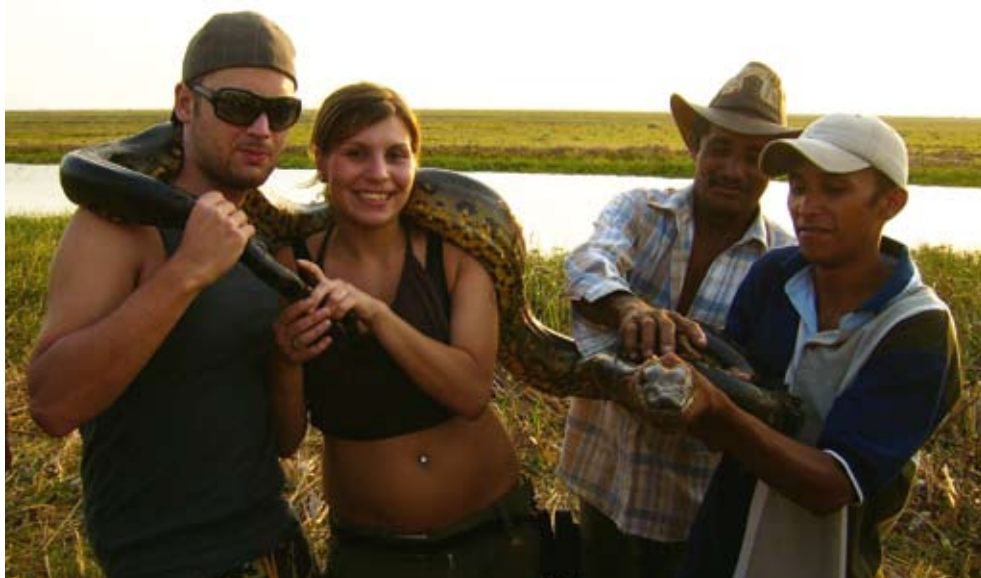
Att ha en sju meter lång, vild anakonda på axlarna är en väldigt speciell känsla.