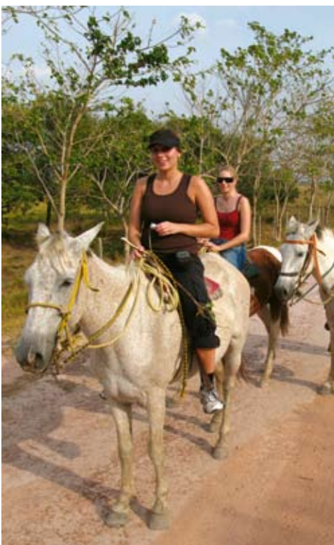
Ett av de bästa sätten att uppleva de stora slätterna är från hästryggen.