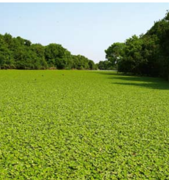
Vid floderna är växtligheten riklig. Olikt slätterna före regnen i april.

Till tonerna av salsa som spelas från stereon i jeepen och som blandas med syrsornas starka läten, dansar vi oss svettiga i den varma, svarta natten med månen och det stjärnbestrodda himlavalvet som enda ljuskälla. ●