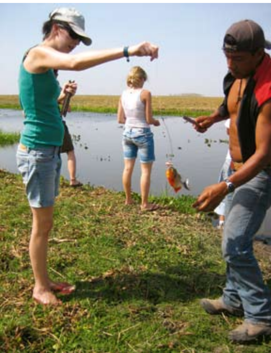
En hjälpsam guide tar loss den nyfångade pirayan.