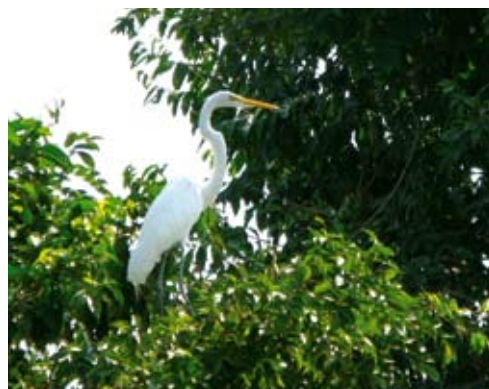
Från utkiksplatsen i trädtoppen syns eventuella rovdjur väl.