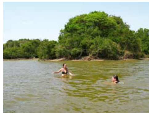
Badstund, javisst! Trots pirayor, kajmaner och anakondor.