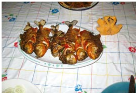
Grillad piraya – en god middag efter en händelserik dag.